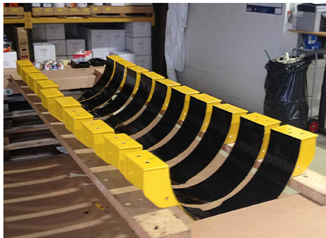
飞溅区夹具敷涂完成