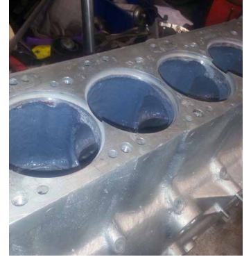
施工完毕的发动机组