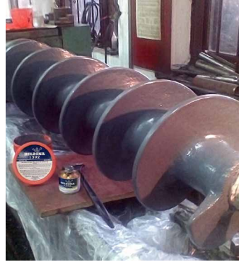
螺旋式输送带得到保护